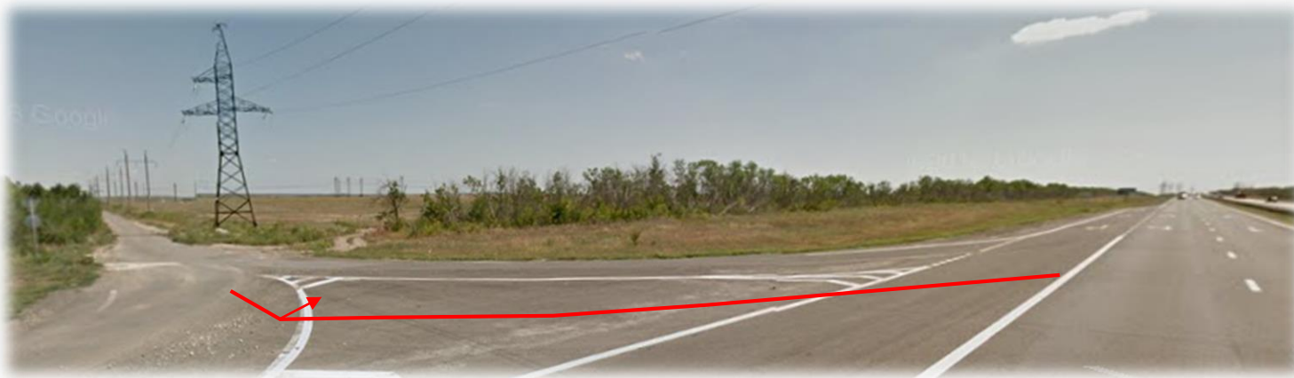
Фото №1. Пересечение Р-22 и проселочной дороги

Земельным массивом на праве собственности владеет ООО «Парк Волгоград»: