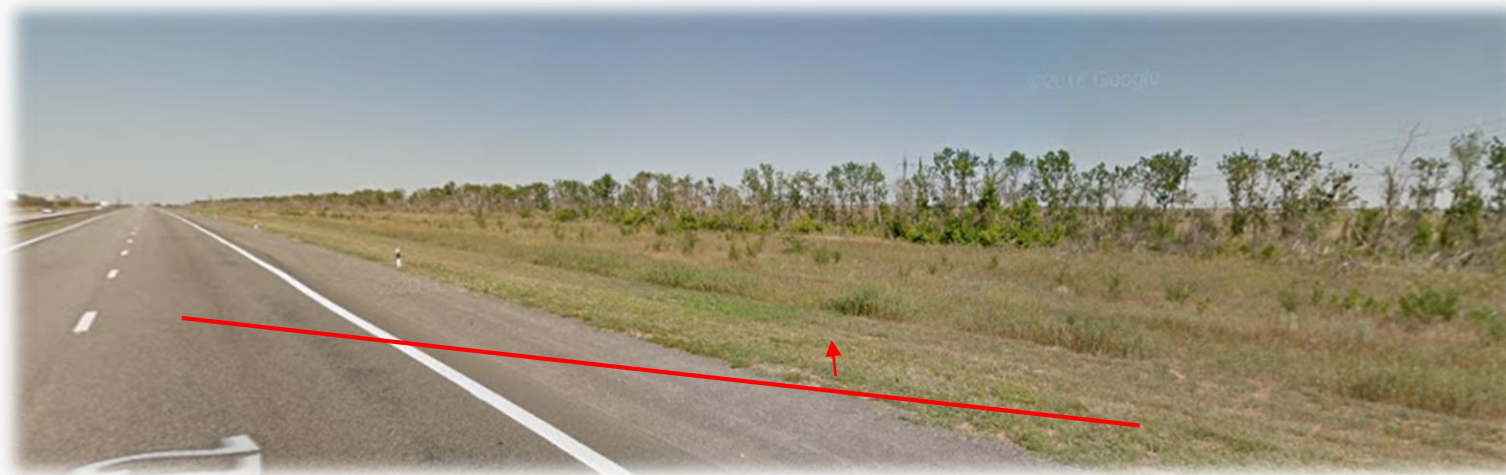
Фото №2. Вид с Р-22 (на Москву)

Стоимость земельного участка составляет 6 млн.р. за гектар.